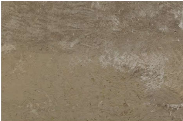
Passage des Récollets, Paris